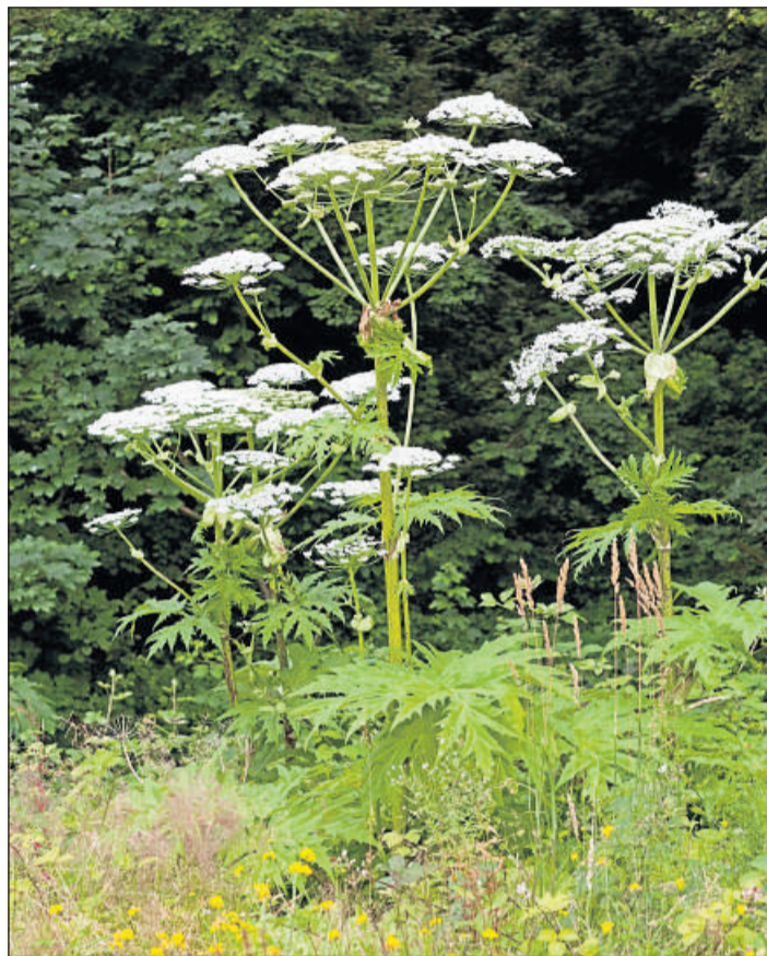
Ihn sollten Hobbygärtner im Blick haben: Der Riesen-Bärenklau ist ein eindrucksvolles Gewächs. Er wird bis zu fünf Meter hoch.

Das auch als Herkulesstau- de bekannte Gewächs ist dazu noch stark auf dem Vormarsch: Jede Pflanze bildet zwischen 10 000 und 50 000 Samen, die sogar schwimmen können. Der Riesen-Bärenklau kommt häufig an Flüssen und Bächen, auf Brachland und an Wegesrändern vor, findet aber natürlich auch seinen Weg in den Garten. Er lässt sich dort auf nährstoffreichen Standorten nieder, die nicht zu trocken sind. Was Hobbygärtner wissen müssen, erklärt die Landwirtschaftskammer für das Saarland: